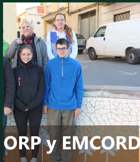
ORP y EMCORD