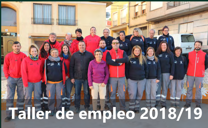
Taller de empleo 2018/19