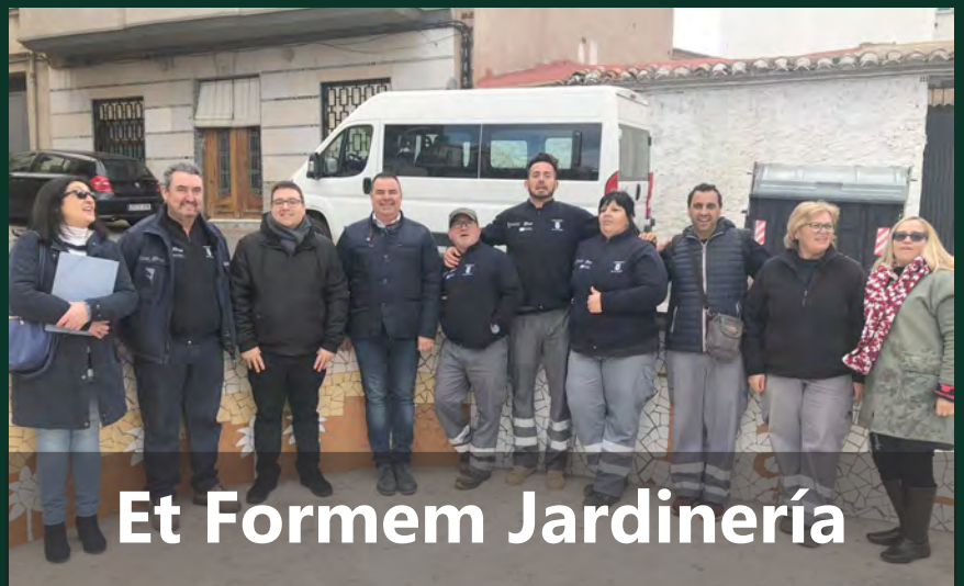
Et Formem Jardinería